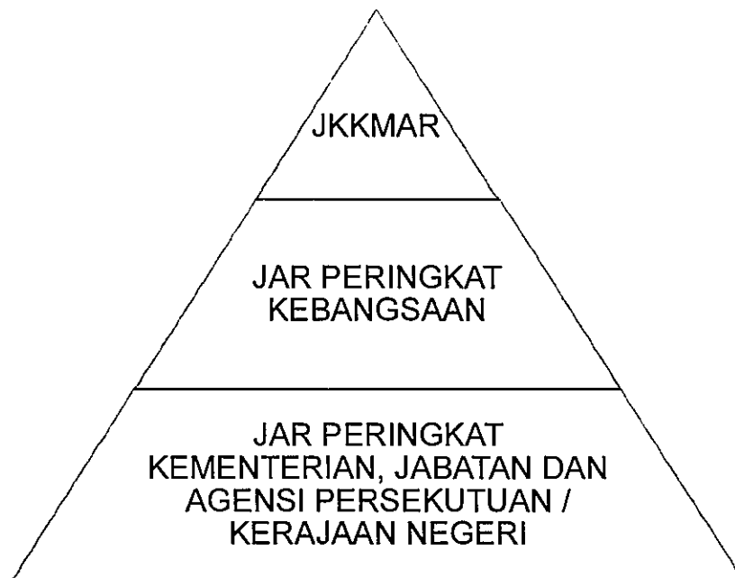
Rajah 1: Hubung Kait Peranan JKKMAR, JAR Peringkat Kebangsaan dan JAR Peringkat Kementerian, Jabatan dan Agensi Persekutuan / Kerajaan Negeri